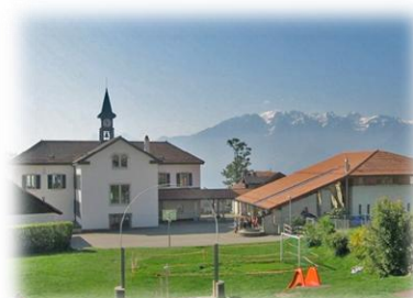
JONGNY Ch. de la Fontaine 1 / Ch. de la Poste 2 1805 Jongny