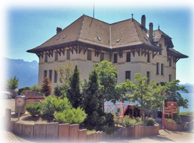
CHARDONNE Ch. de la Fin 18 1803 Chardonne