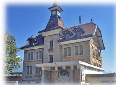
CORSEAUX Av. Félix Cornu 1802 Corseaux