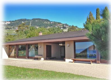
MERUZ Ch. de Meruz 1804 Corsier-sur-Vevey