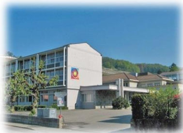
CORSIER Rue du Collège 7 1804 Corsier-sur-Vevey