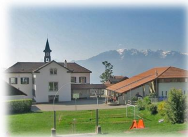
JONGNY Ch. de la Fontaine 1 1805 Jongny