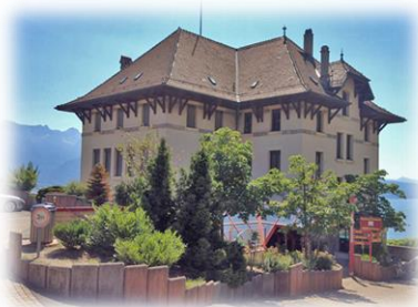
CHARDONNE Ch. de la Fin 18 1803 Chardonne